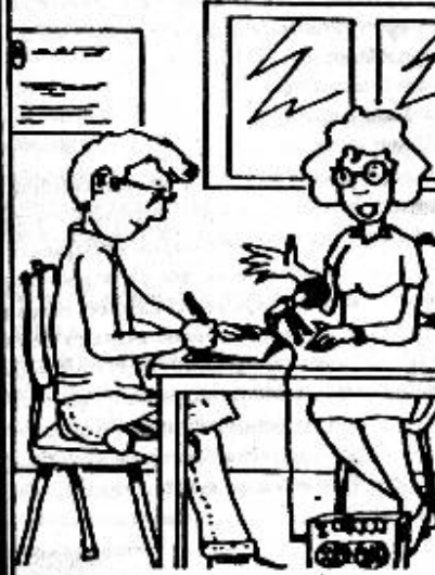
2. FASE TRABAJO DE CAMPO