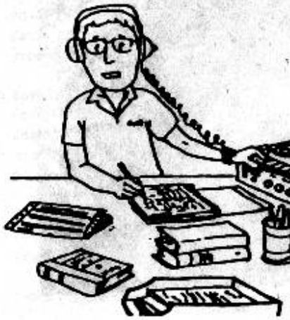
3. FASE ANALÍTICA