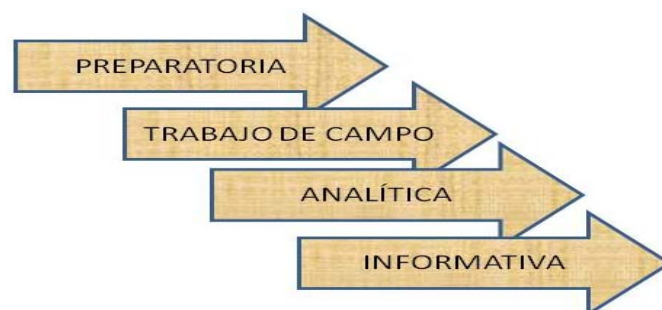
Figura 3.1 Proceso de investigación cualitativa

En la figura 3.1 presentamos nuestra visión de lo que consideramos el proceso de investigación. Intentamos expresar a través del gráfico el carácter continuo del mismo, con una serie de fases que no tienen un principio y final claramente delimitados, sino que se superponen y mezclan unas con otras, pero siempre en un camino hacia delante en el intento de responder a tu cuestiones planteadas en la investigación. Consideramos que se dan cuatro fases fundamentales: preparatoria, trabajo de campo, analítica e informativa.