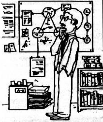
1. FASE REFLEXIVA